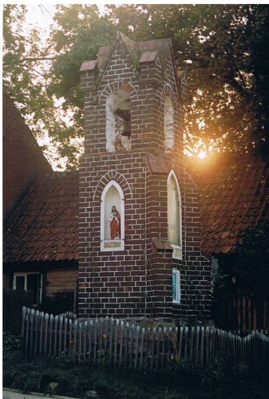
zabytkowa kapliczka w centrum wsi