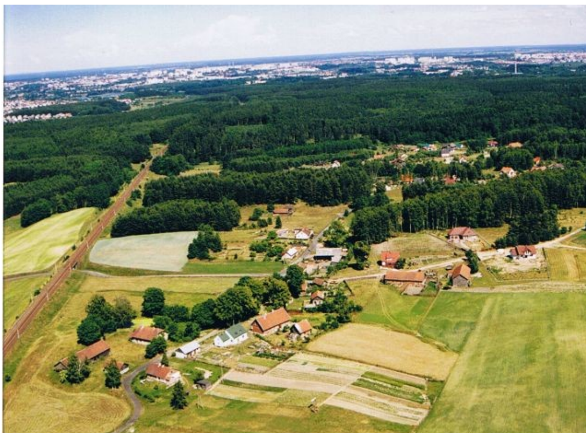
Widok wsi Gronity z „lotu ptaka”