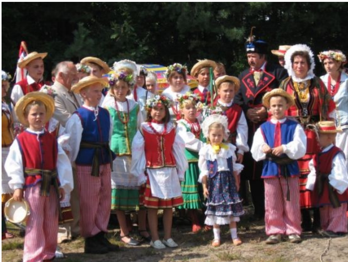
Dzieci i młodzież z Gronit w inscenizacji ludowych obrzędów warmińskich

Widoczny jest duży potencjał twórczy i zaangażowanie dzieci i młodzieży w organizowaniu imprez kulturalno-sportowych. W 2007 roku aktywnie uczestniczyli wraz z dorosłymi w wystawieniu inscenizacji warmińskich obrzędów ludowych, występując w strojach warmińskich, śpiewając i mówiąc po warmińsku. Dzieci i młodzież chętnie uczestniczą w corocznych akcjach sprzątnięcia wsi okolic, piknikach i organizowanych w Granitach okresie wiosenno-letnim konkursach sportowych.