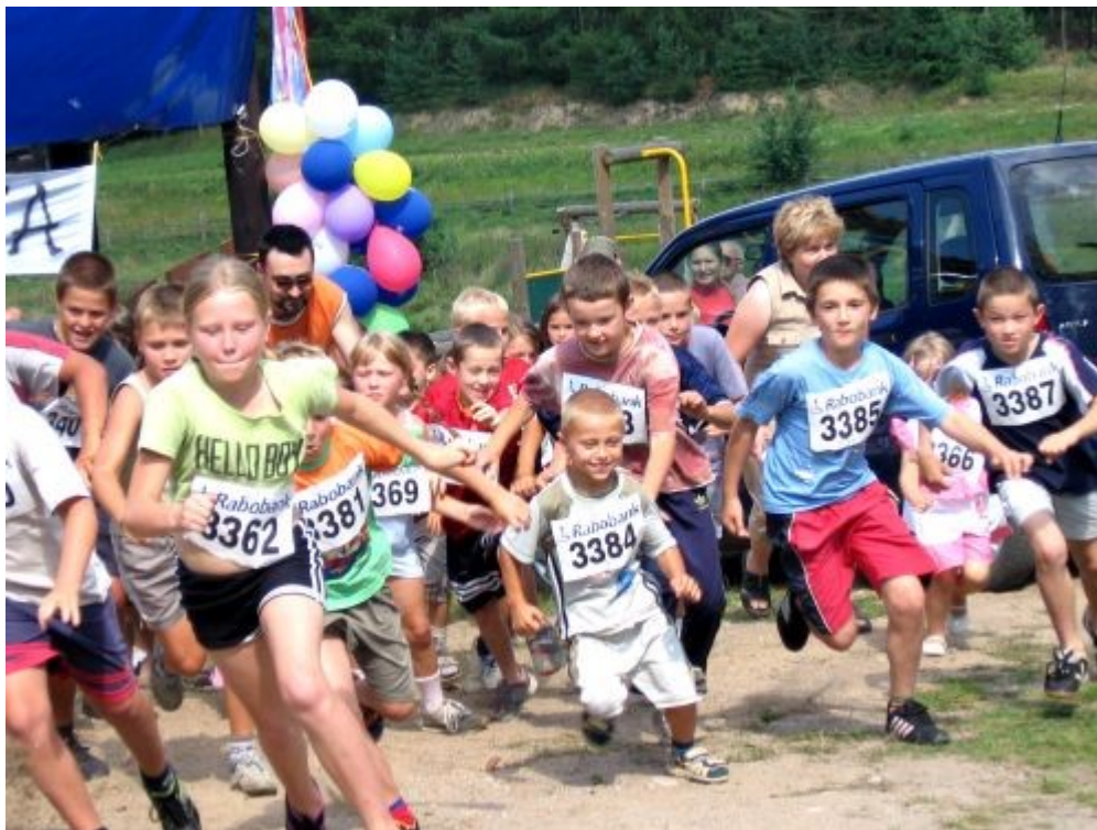
I od 70 lat bieg przełajowy w Gronitach o Puchach Wójta Gminy Gietrzwałd

W Gronitach jest coraz więcej dzieci i młodzieży, która nie ma co ze sobą zrobić w czasie wolnym - pojawiają się problemy wychowawcze, tzw. beczynność, wałęsanie bez celu, stanie grupkami pod sklepem itp. Należy temu przeciwdziałać przez stworzenie warunków tj. zorganizowanie świetlicy, organizowanie czasu wolnego, aktywizację przez czynne włączanie w działania dorosłych. Jednocześnie widzimy potrzebę zaznajomienia najmłodszych mieszkańców z historią i tradycją ziemi, w której żyją i mieszkają.